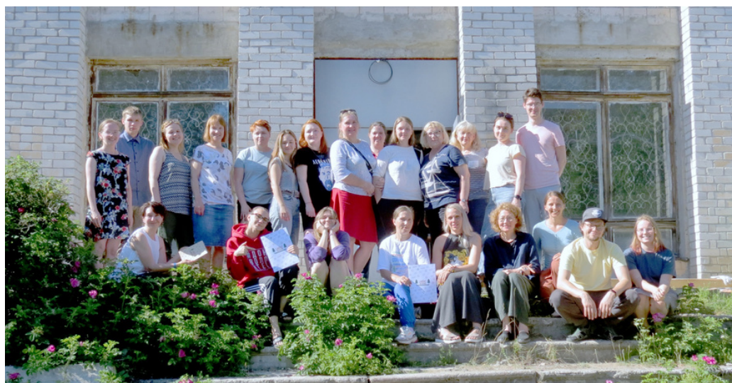
Стратегический интенсив "Laucat" июль 2021

Фонда президентских грантов - проект "Стратегический интенсив Лаучат" (1 907 141 рублей)